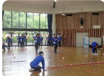
講座の後半はプチ運動会の企画。 まずは障害物競争!