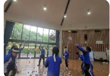
次は玉入れ! ルール説明や安全面の配慮も。