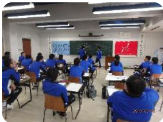
レクは企画8割・運営2割! 実は本番までの準備が一番大変。

レクリエーション養成講座では、レクの役割や理論についての講義の後、アイスブレイキングやイベントの企画・運営を実際に行っている。