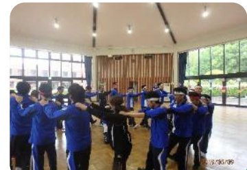
プチ運動会は終始みんな笑顔! 運営も上手いきました😊