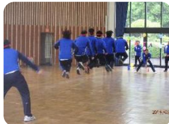
チーム対抗の大縄跳び。 みんなで大きな声でカウント!