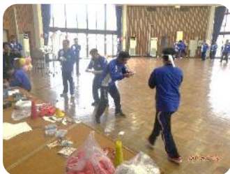
借り物競争は 品物の配置にもこだわりが…?