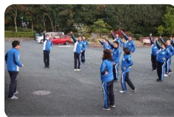
教育手法④かけあいコール 受講生の反応を確認しながら教える