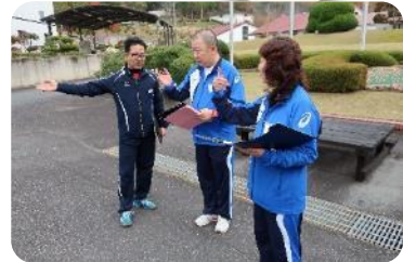
教育手法②朝礼 指導者としてどう振る舞うべきか?