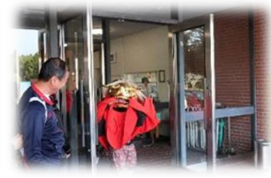
館内の厄除けもしっかり！