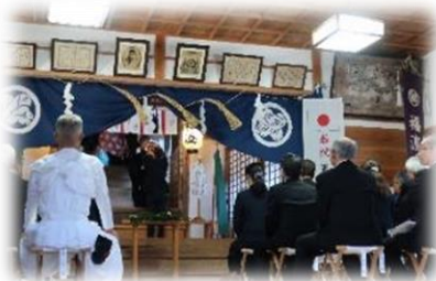
福渡八幡神社で行われる 五穀豊穡の神事にセンター長も参拝

世間ではハロウィン色が強くなる10月末、友愛の丘には福渡八幡神社の秋季例大祭巡行として地元のお神輿や獅子舞が訪れました。