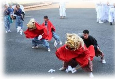
友愛の丘の前庭で獅子舞が舞う