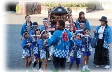
伝統を引き継ぐ子ども神輿も元気いっぱい！

編集後記 いよいよ冬が本格化してきました。友愛の丘では朝晩の冷え込みが激しくなってきましたので、研修へご参加される方は、防寒対策を忘れずに！また、友愛の丘は12/26まで開館しておりますが、本通信は今年最後となります。皆様、本年もお世話になりました。新年もいっそうのご愛顧を賜りますようお願い申し上げます。(熊五郎)