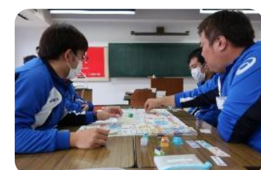
どんな教育器材があるのか? 実際に自分で使ってみる