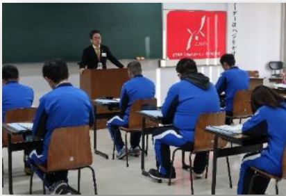
UAゼンセンの政策制度実現の 取り組みとは？