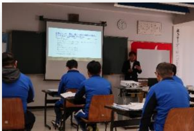
組合出身の県議から議員として の取り組みを聞く