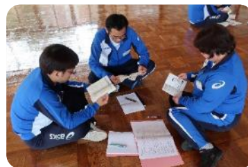
教育手法①アイスブレイキング 教える内容は何にするか?