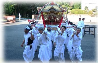
大人神輿は迫力満点！