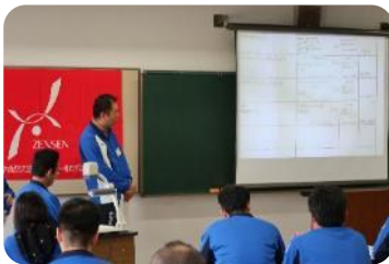
教育カリキュラムの作成方法を学び、実際に作成