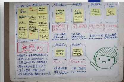
← ↑ 政治活動の効果的な取り組み 方法を自分たちで考える