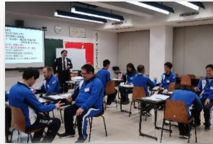
公職選挙法について学ぶ