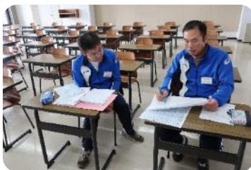
教育手法③かると学習 理解してもらうにはどう伝えるか?